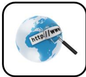
la banda ancha