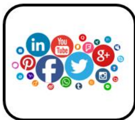
los medios sociales