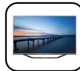
la pantalla plana