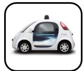
los coches sin conductor