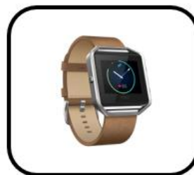
los relojes inteligentes