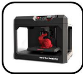
la impresora 3D