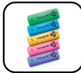
las memorias USB